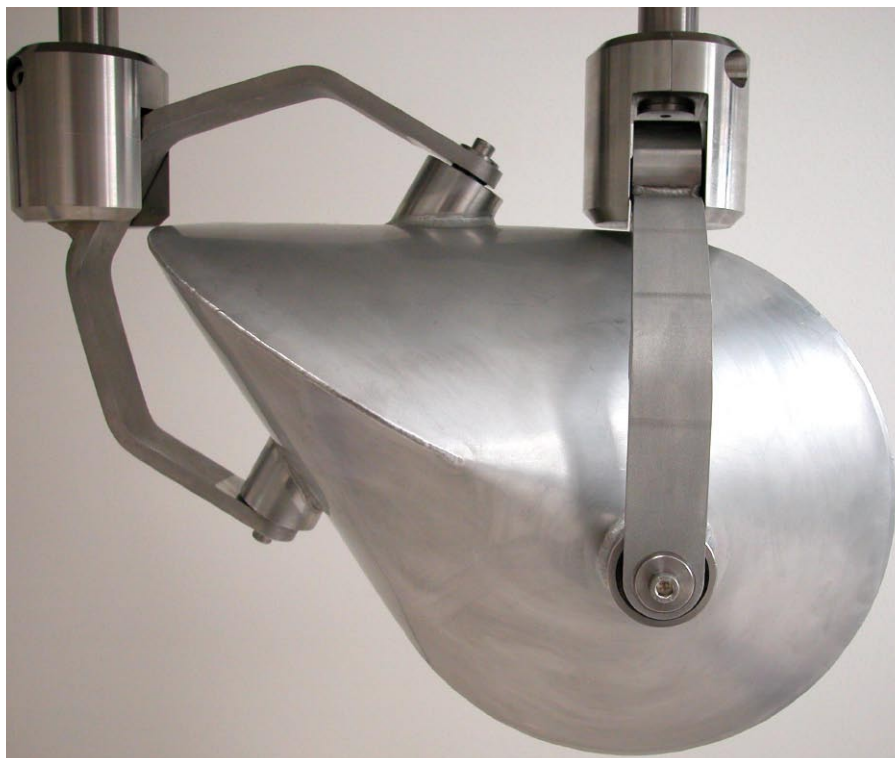
Figure 1 : La forme particulière de l'Oloïde.

Oloïde a fait l'objet d'une étude par le Cemagref (A. Lienard, C. Crétollier, Lyon 2009), avec le concours du Satese de l'Ain, sur la station de Saint André de Bouchoux, pour valider son intérêt dans cette application.