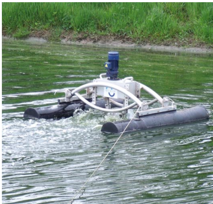
Figures 3 et 4 : Oloïde sur la lagune de Saint-André le Bouchoux.

raison de la très faible immersion de la partie siphonoïde et de la proximité du talus de la digue.